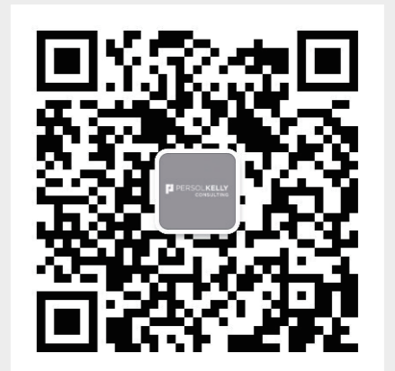
PERSOLKELLY Consulting 微信公众号